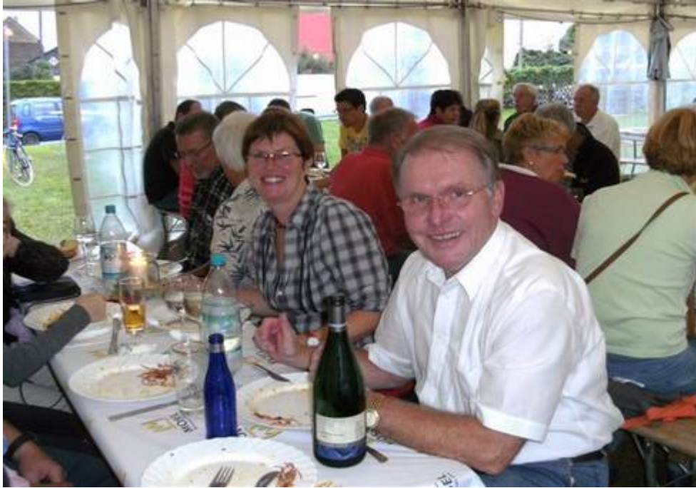
„Nudelparty in Erden an der Mosel“